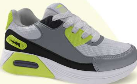
05 BRANCO/A. LIMÃO