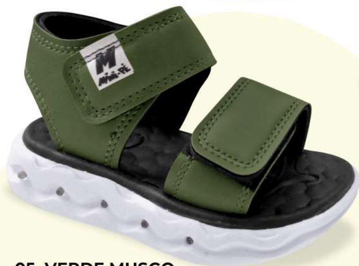
05 VERDE MUSGO