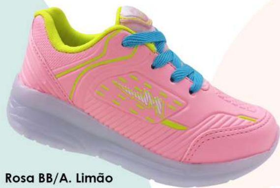
Rosa BB/A. Limão