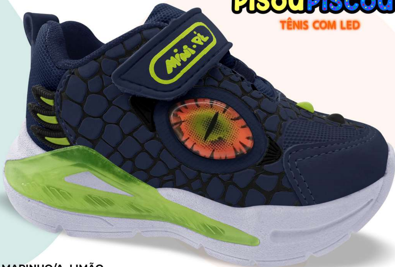
01 MARINHO/A. LIMÃO