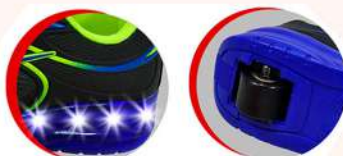
Exclusivo Sistemas de Rodinhas / com led