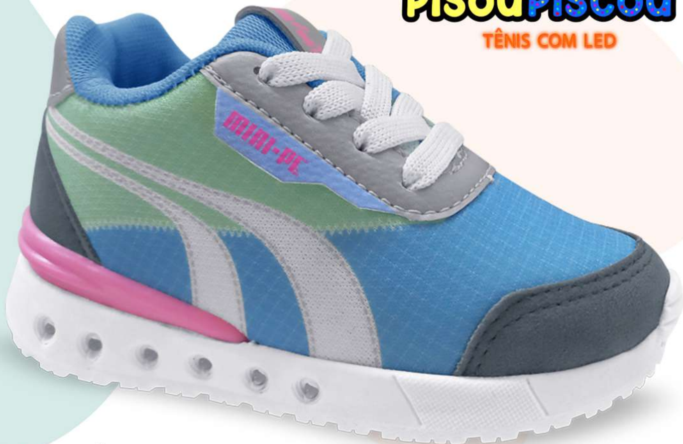
01 AZUL BB/ROSA BB