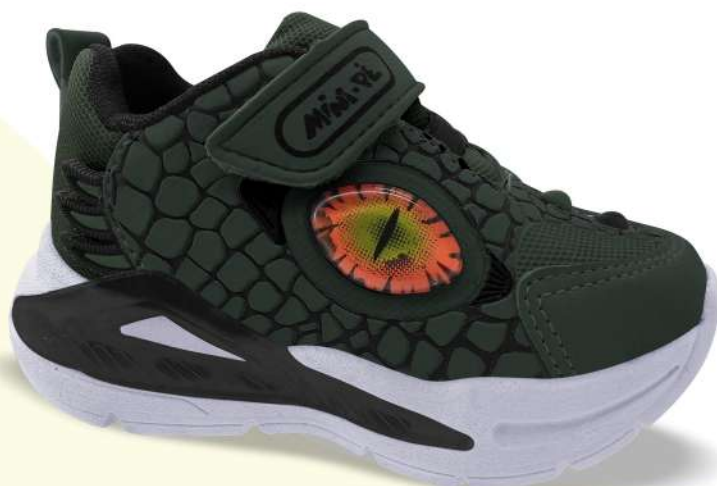
03 VERDE MUSGO