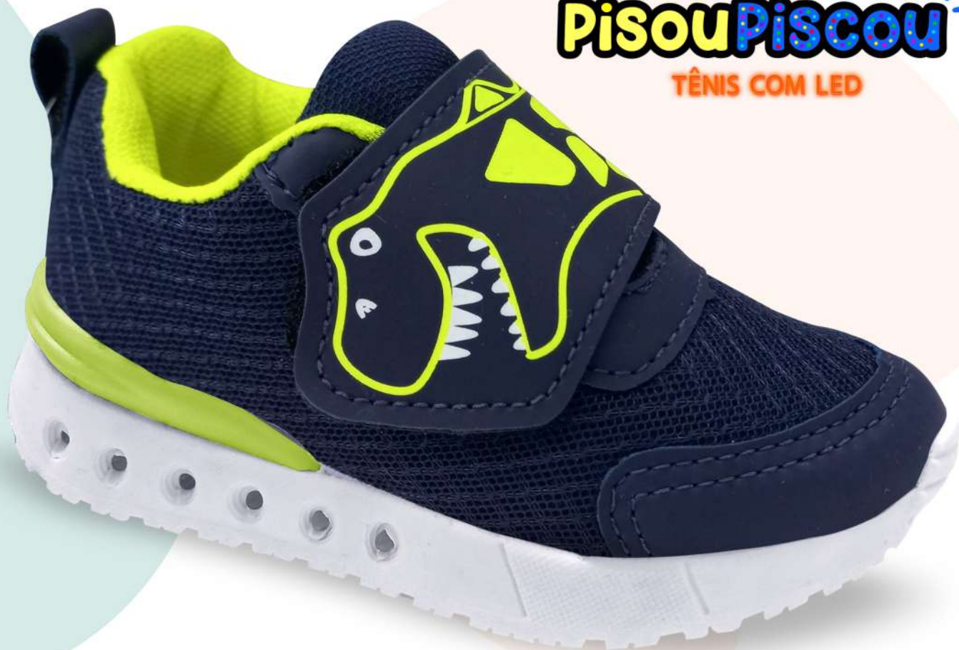
01 MARINHO/A. LIMÃO