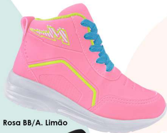
Rosa BB/A. Limão