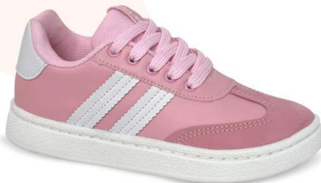
03 ROSA BB