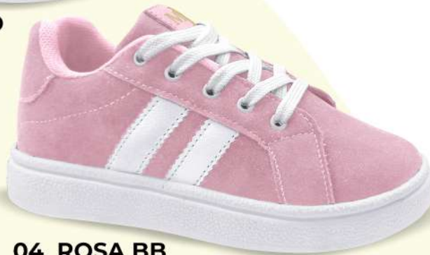
04 ROSA BB