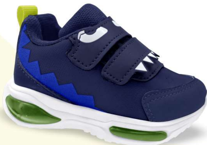
03 MARINHO/A. LIMÃO