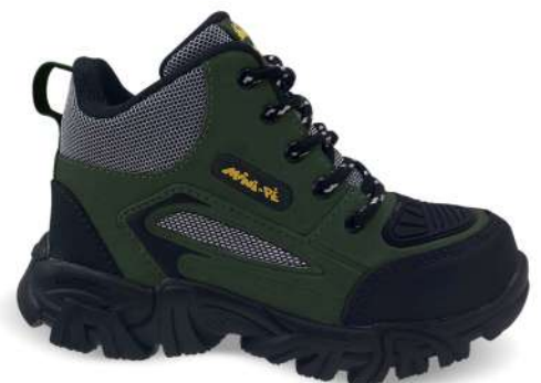
04 VERDE MUSGO