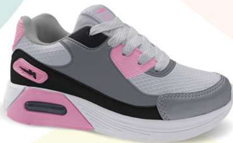
02 BRANCO/ROSA BB